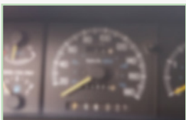
Nedostatečně zaostřeno na celkový nájezd, který není čitelný.