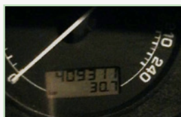
I když je fotografie tmavá, je údaj dobře čitelný.