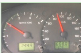
Dobře čitelný údaj celkového nájezdu.